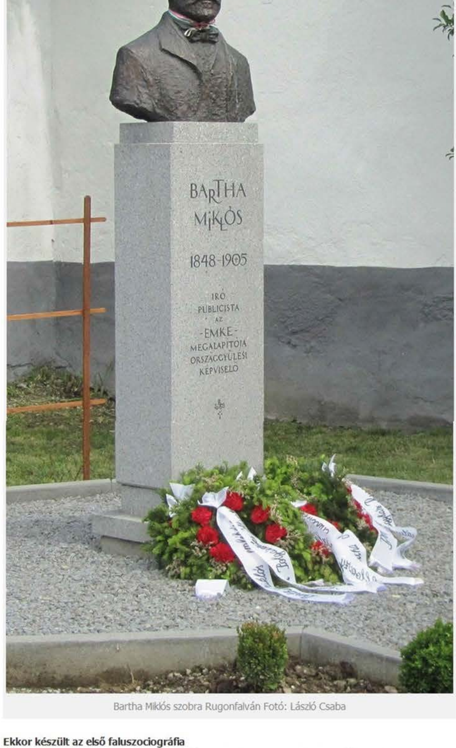
Bartha Miklós szobra Rugonfalván

Egán Darányi minisztertől kapott megbízást 1897-ben arra, hogy tanulmányozza a kelet-felvidéki (kárpátaljai) helyzetet és készítsen róla jelentést, dolgozza ki a szükséges segélyezési, képzési és felvilágosítási formákat, próbálja alkalmazni azokat a gyakorlatban, hogy egy fejlettebb mezőgazdasági kultúrával, államilag támogatott módon próbálják megakadályozni a kivándorlást és segítsék az ottani ruszin többségű lakosság boldogulását. Bartha Miklós politikusként és elkötelezett publicistaként vállalt szerepet ebben az ügyben – mellesleg baráti szálak is fűzték Egánhoz –, úgyhogy 1897 és 1901 között Munkácsról Alsóverecskéig, Ökörmezőtől Husztig tájékozódott a ruténok életmódjáról, szokásairól vagyoni és kulturális helyzetéről.